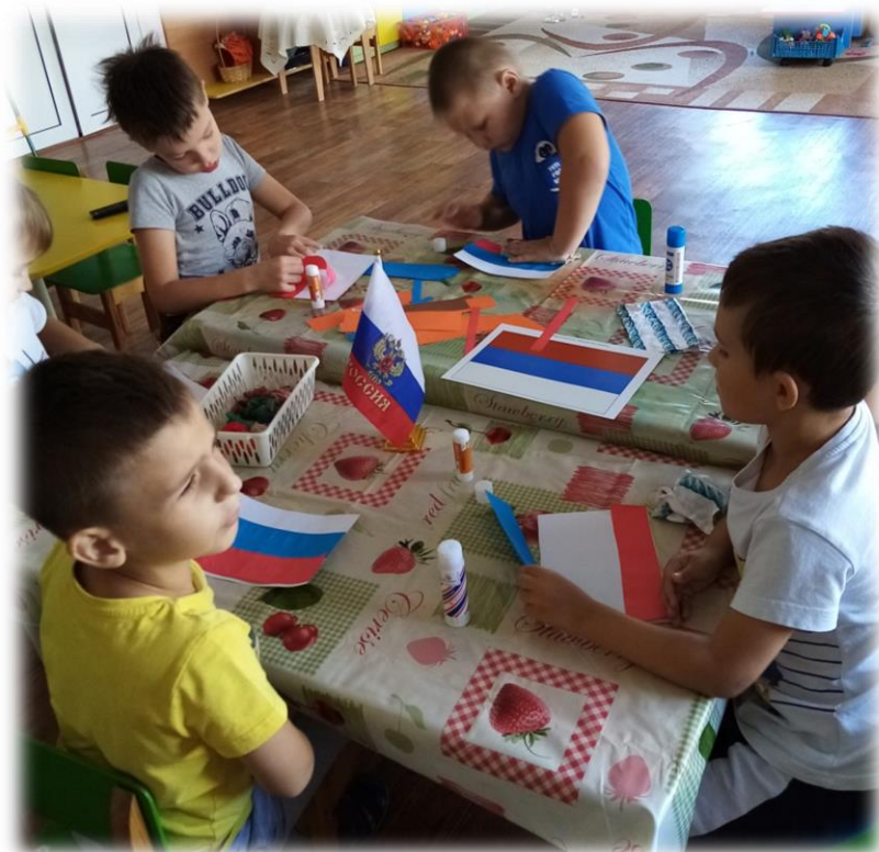
Делали флаг России своими руками.